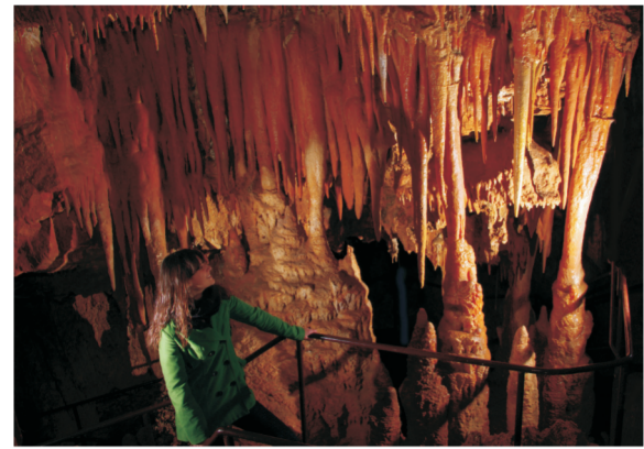
BAREDINE - Jama/Cave/Höhle/Cave - 7 km