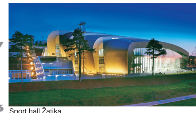
Sport hall Žatika