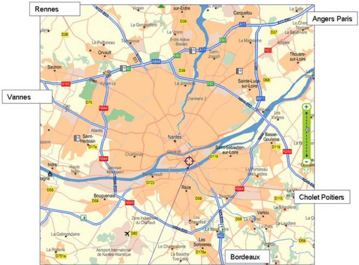
Complexe sportif Mangin Beaulieu rue Louis JOXE 44 200 Nantes